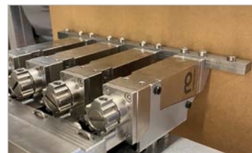
Presto come pistola multipla per applicazioni fino a 165 mm di larghezza