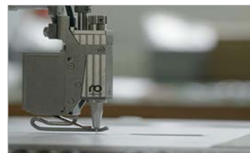
Sempre per l'applicazione in cordoli per l'incollaggio di lati e fondo